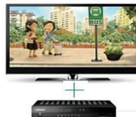
별도 셋톱박스 (출시예정)