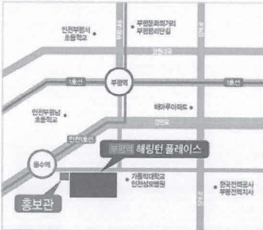
현장 및 홍보관 위치도