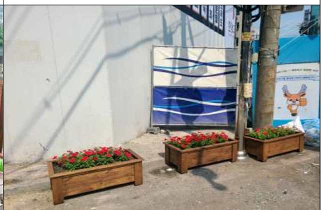
꽃길 만들기(클린하우스 부근)

※ 검단동 주민자치회는 주민자치 사업 진행 시 코로나19 방역수칙을 준수하여 진행하였습니다.