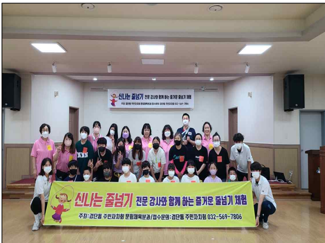
신나는 줄넘기 단체 사진