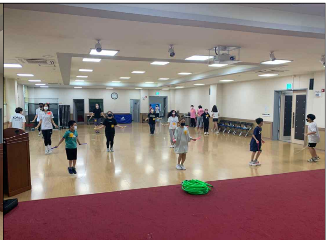
신나는 줄넘기 행사1