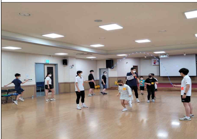
신나는 줄넘기 행사2