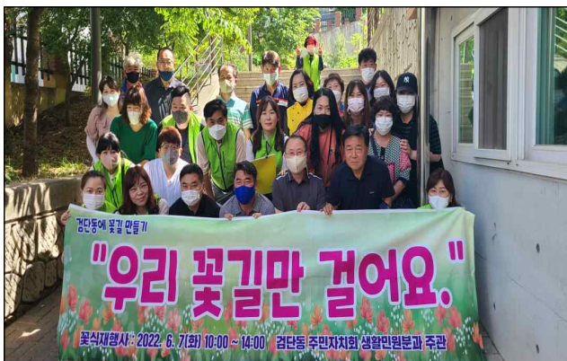
검단동 꽃길만들기 단체사진