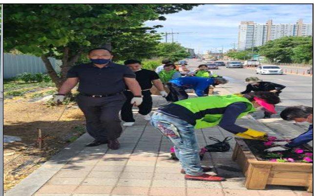
꽃길 만들기 식재 행사