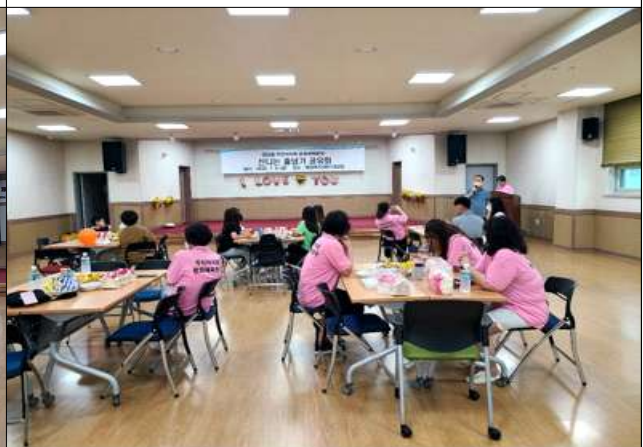
신나는 줄넘기 공유회