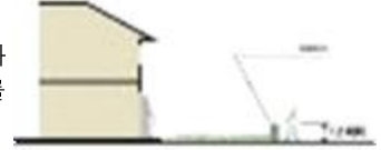
<별표 1-1> 단독주택용지 건축물 허용용도·건폐율·용적률·최고층수·세대수