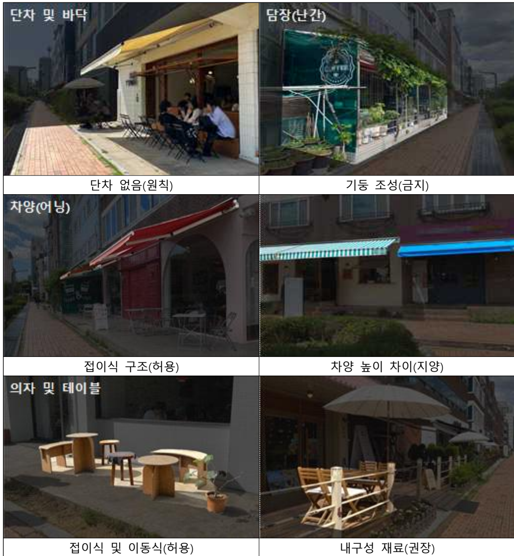
【 테라스형 전면공지 시설물 예시 】