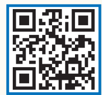
안전신문고 앱 바로가기