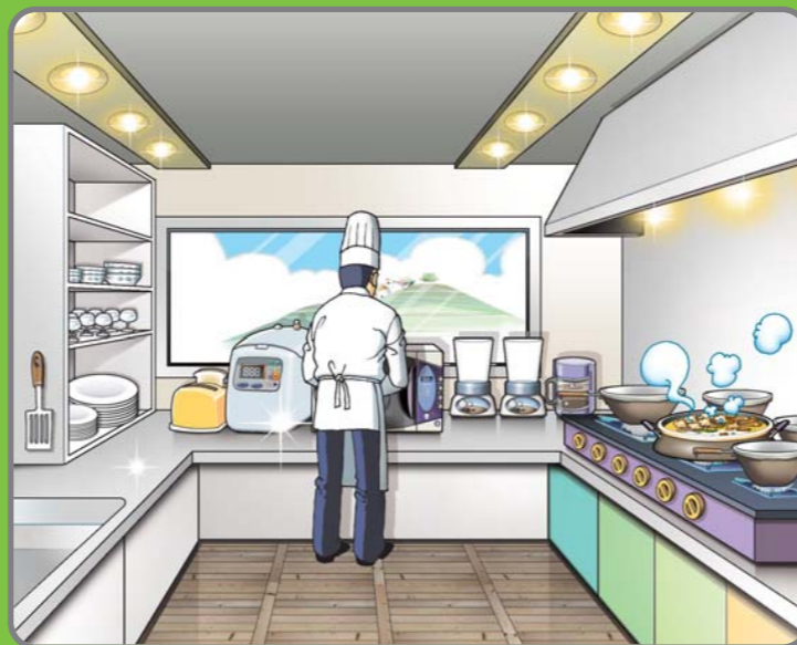
1 주방 내부를 청결하게 관리