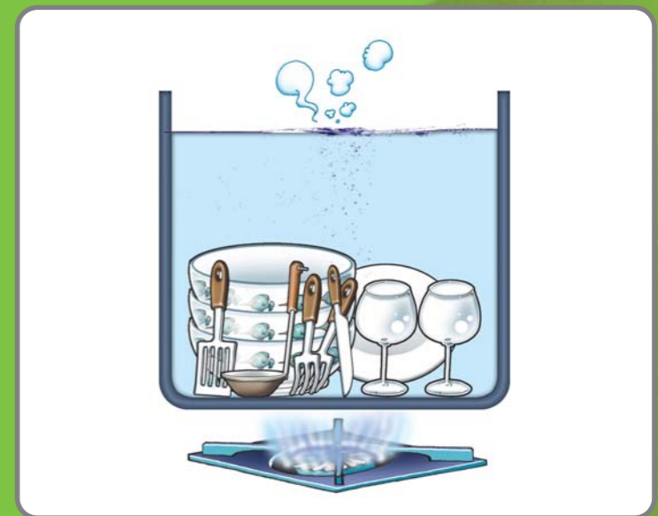
3 조리기구와 식기는 사용 후에 세척·살균하여 항상 청결하게 유지·관리