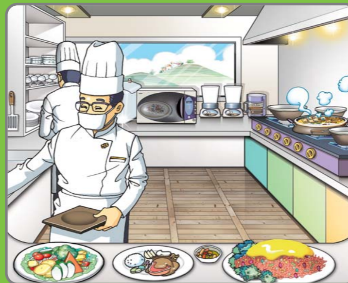
2 손님이 주방 내부를 볼 수 있도록 개방형 주방 설치