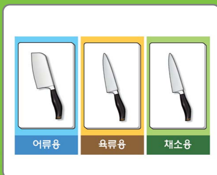
4 어류·육류·채소류를 취급 하는 칼·도마는 각각 구분하여 사용