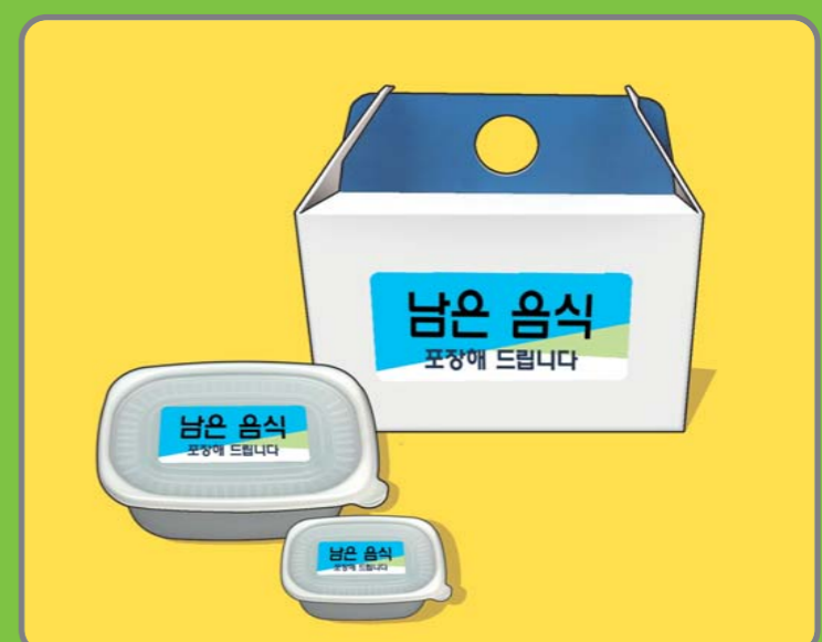
6 남은 음식 재사용 안하기, 손님에게 남은 음식 포장하여 제공하기