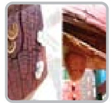
목재의 노후 및 유해균 서식