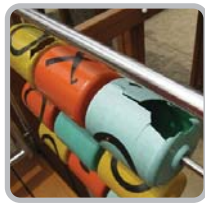
플라스틱 재료의 내구성 저하