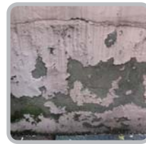
시멘트 마감처리 부분의 훼손