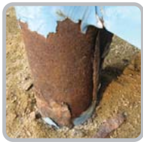
금속 시설물의 녹 발생