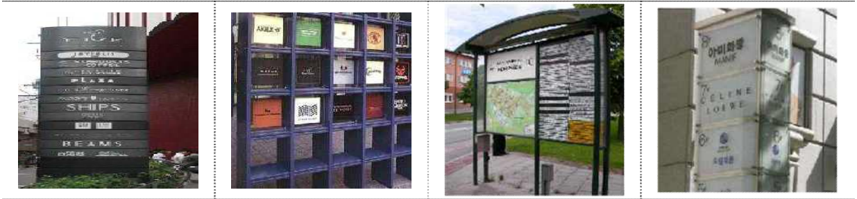
[그림 3-8-1] 지주이용광고물의 사례