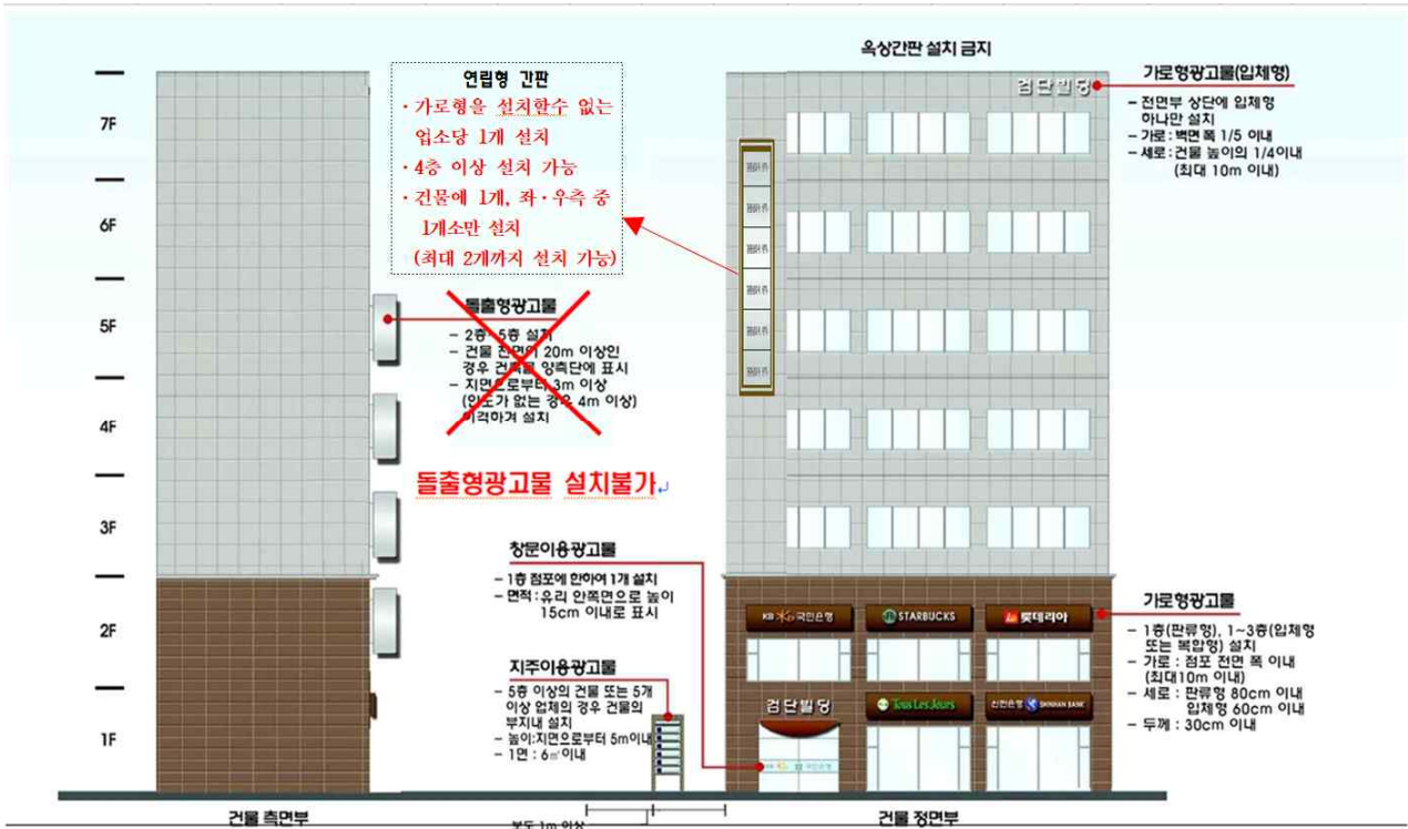
[그림 3-8-2] 광고물의 표시방법 종합 예시도