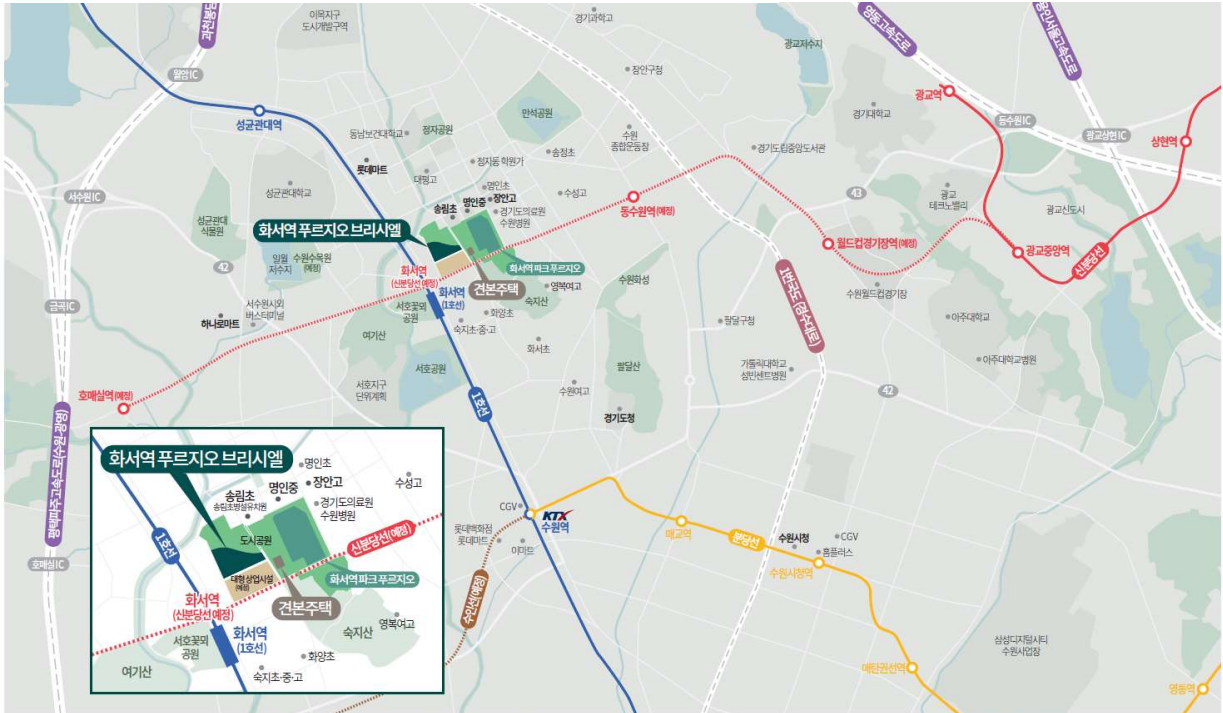
※본 홍보물의 자체도는 도시자의 이해를 돕기 위해 제작된 이미지이며, 실제와 차이가 날 수 있습니다. ※상기 개발 및 교통, 학교 배정 등의 계획에 대한 사항은 후속 관계 기관의 시정에 따라 변경될 수 있으며, 이는 당사와의 무관함을 알려드립니다. ※청약신청 및 계약 전에 반드시 입주지 모질고, 모델하우스, 현장 견학 기간에 확인하기 바랍니다. ※현재 지원도에 기재된 노선은 예비타당성조사 단계에서 검토된 노선으로 향후 기본계획수립, 실시계획 등을 거쳐 구체적인 노선 및 정거장 등이 결정될 계획입니다.