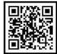
마음으로 홈페이지 QR코드