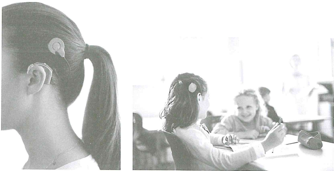
<인공달팽이관 외부장치 착용사진>

보청기로도 소리를 듣지 못하는 고심도 난청인이 받는 수술로 내부 임플란트(달팽이관 삽입)와 외부 장치를 통해 외부의 소리를 전기적 신호로 변환하여 청신경을 자극해 소리를 듣게 되는 수술입니다.