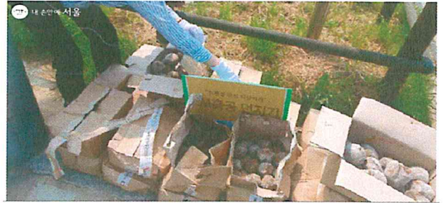
EM 흙공 만들기

EM(Effective Micro-organisms)은 유용미생물이라는 뜻이다. 다양한 미생물들이 하나의 유기체와 같이 상호작용하면서 주변의 환경을 이롭게 한다는 것이다. EM은 친환경정책과 관련하여 최근에 많이 이용되고 있다. 더욱이 EM 흙공은 EM 용액과 황토를 배합한 것으로 수질 정화와 악취 제거, 유기물 발효 및 분해에 탁월한 효과가 있는 것으로 알려져 있다.