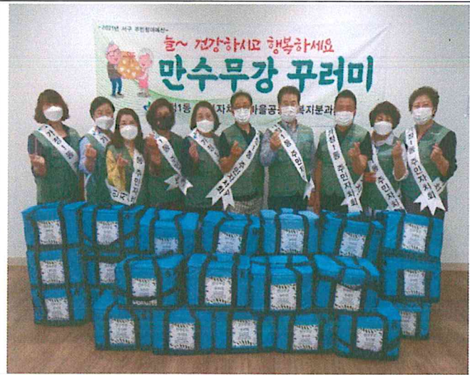
가정1동 '만수무강 꾸러미'