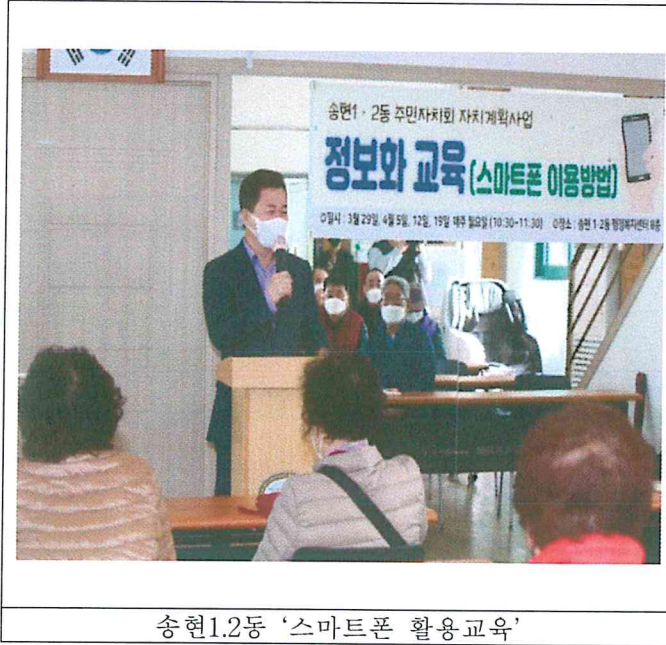
송현1.2동 '스마트폰 활용교육'