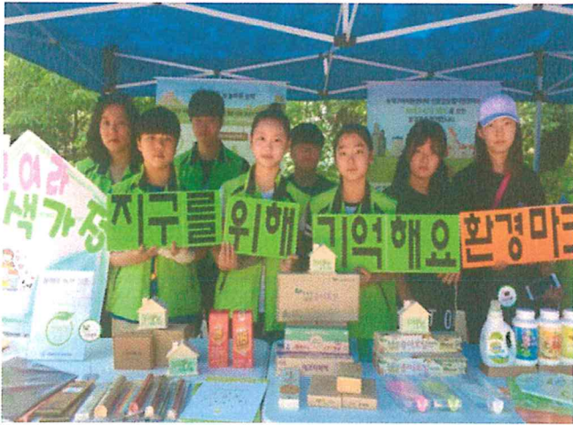
의정부 '녹색상품 사용하기 캠페인'