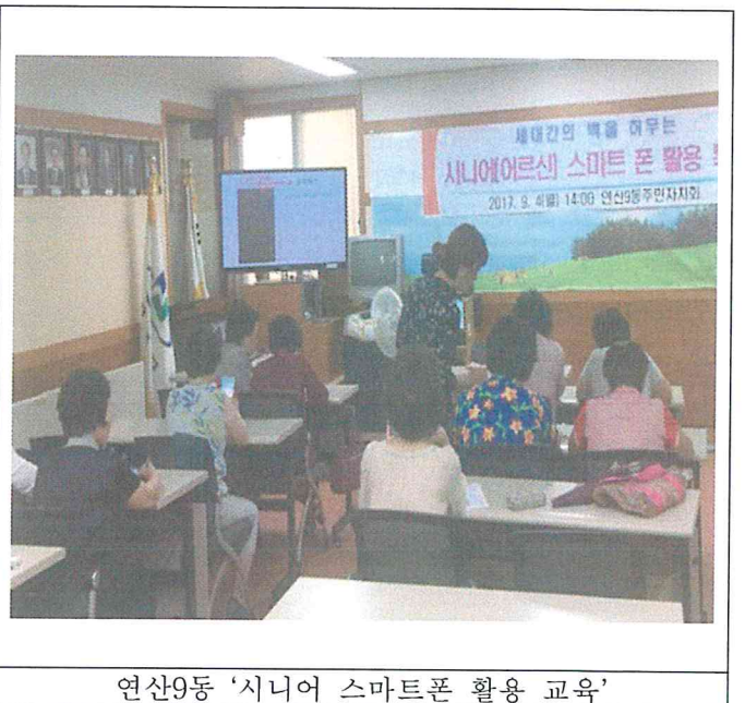
연산9동 '시니어 스마트폰 활용 교육'