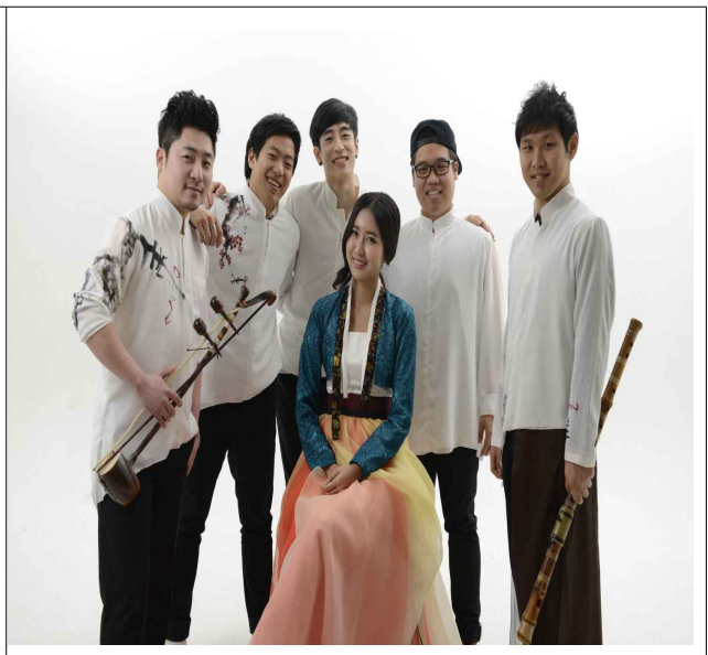
12.13-예비사회적기업 음악창작소 '더울'