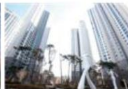
e편한세상 반포 리체