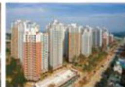
e편한세상 고양 원당