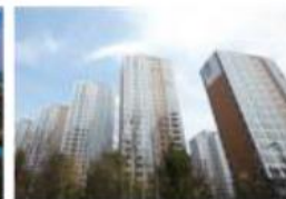
e편한세상 의왕 내손