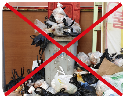
비닐 등 이물질 혼합배출