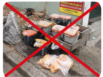
납부필증 미부착 및 무단투기

만약 종량제봉투에 혼합배출 및 불법투기할 경우 100만원 이하 과태료가 부과됩니다.