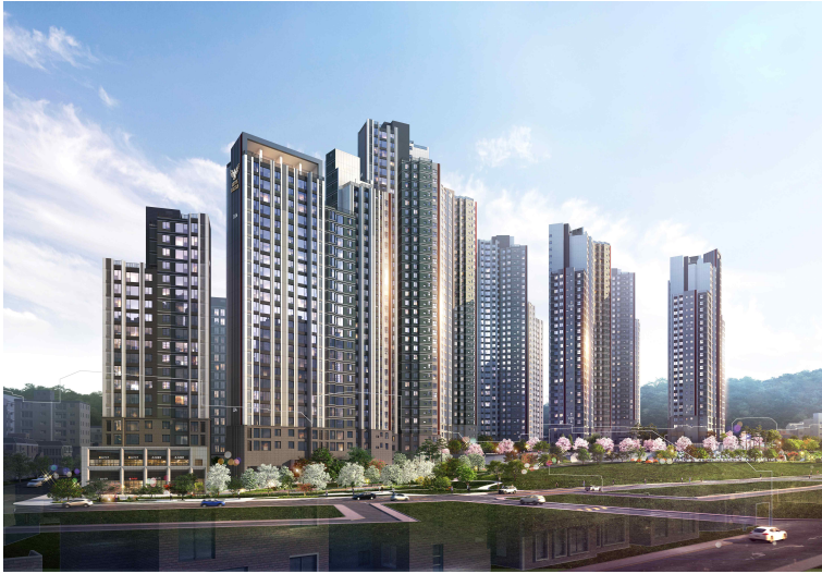
※ 원당역 롯데캐슬 스카이엘 투시도