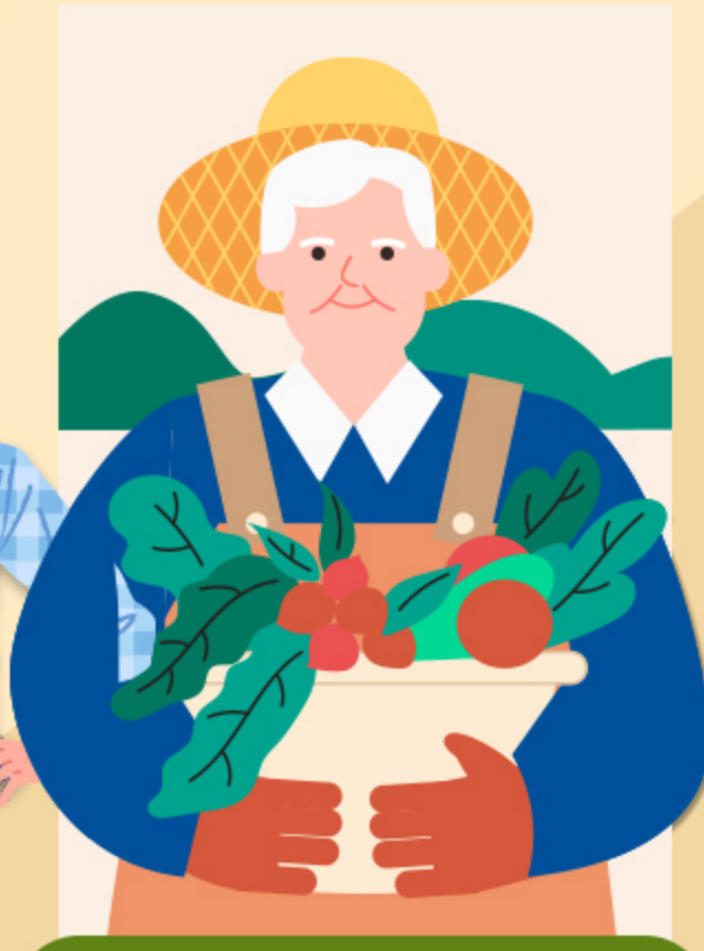
② 고령층 논·밭 작업자