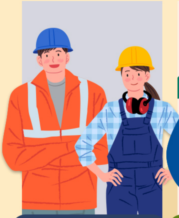
① 공사장 야외근로자