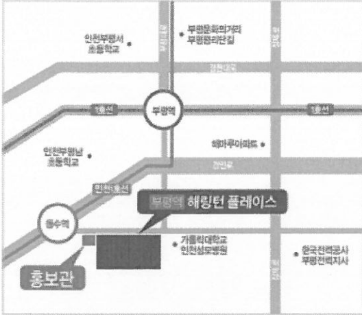
현장 및 홍보관 위치도

인천시 부평구 동수로 22 032)517-8000 총 1,909세대 59㎡/72㎡/84㎡