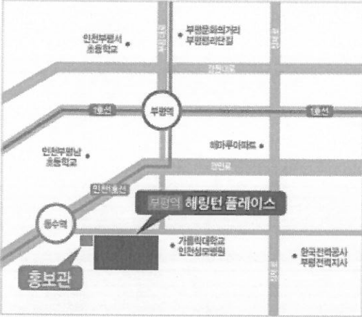
현장 및 홍보관 위치도