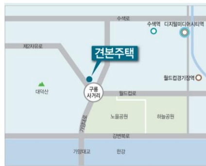
견본주택 주소 : 경기도 고양시 덕양구 덕은동 273-2번지