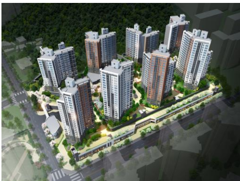
※ 상기 CG 이미지는 소비자의 이해를 돕기 위한 이미지 컷으로 실제와 다를 수 있습니다.

※ 청약 신청 시 내용은 청약자 본인에게 모든 책임이 있으므로, 청약 신청 전 반드시 상세 입주자모집공고의 내용을 숙지하시고 청약하시기 바랍니다.