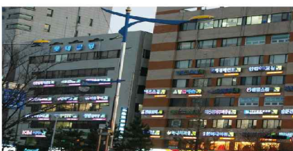
경남 창원시 광고물 정비