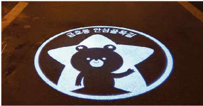
금호동 안심골목길 로고젝터