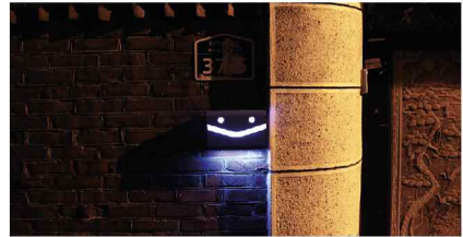
회기동 안녕마을 우편함