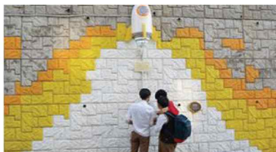
은평구 충암중학교 CPTED