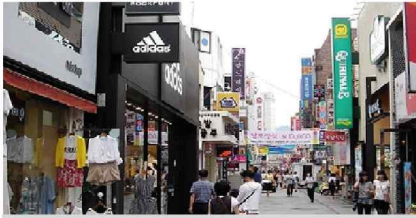
광주시 충장로 먹자골목