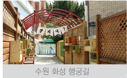
수원 화성 행궁길