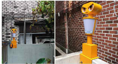
중곡동 안전 사방등