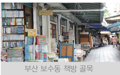
부산 보수동 책방 골목