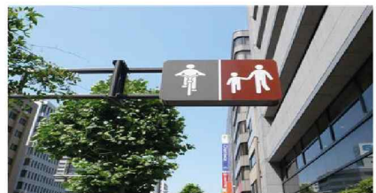
일본 유니버설 디자인