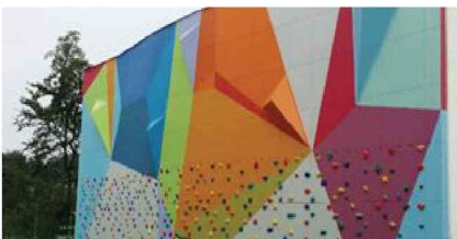
강원도 경포중학교 CPTED