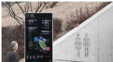
서울 동대문구 안내 시인