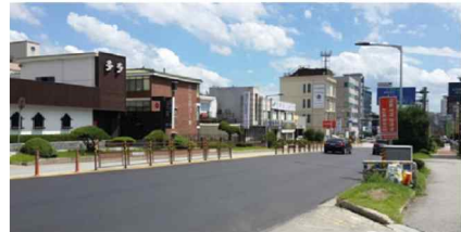
천안시 동남구 교통시설물 정비