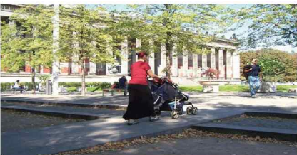
독일 베를린 유니버설 디자인