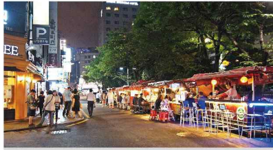
부산 서면 먹자골목