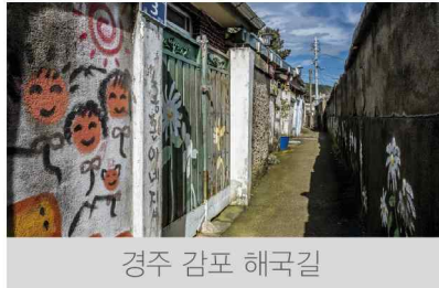
경주 감포 해국길