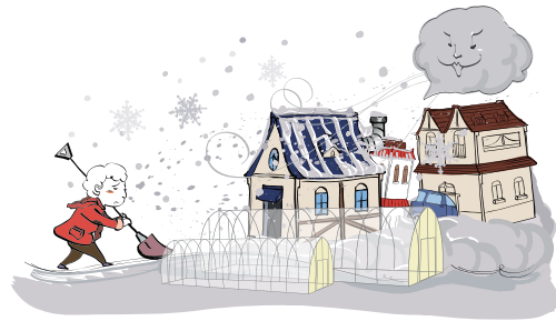
폭설로 온실이 무너졌어요!

주택상품 : 90%보상형, 면적 80m 2 (충남 예산 기준) ※ 지역에 따라 보험료가 달라질 수 있음