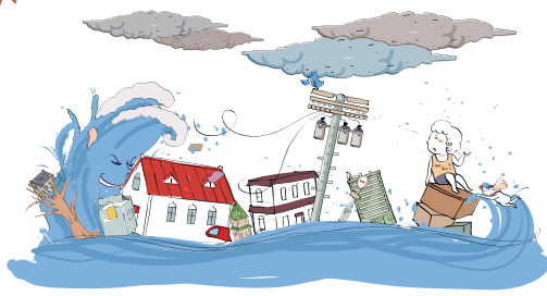
집중호우가 쏟아져서 집이 무너졌어요!