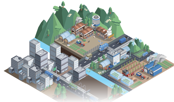
(농촌, 어촌, 산촌, 도시 어디서나 가입 가능)