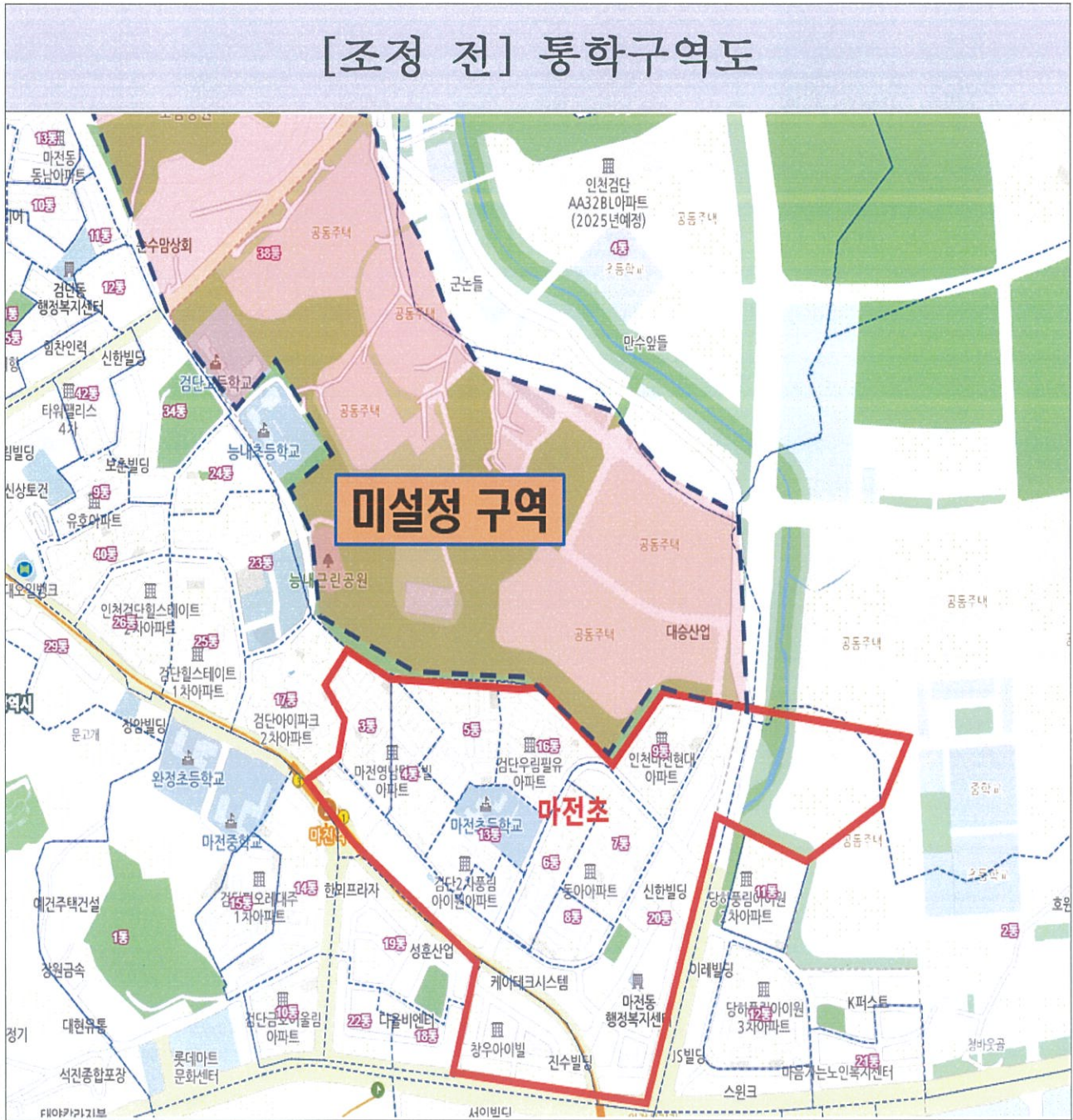
[첨부1] 조정 전·후 통학구역도