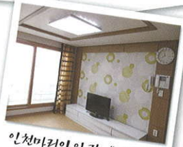
인천마리아의 집 "거실"