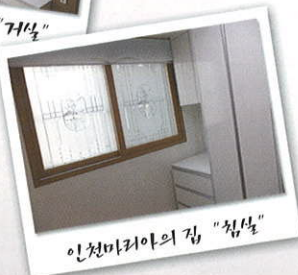
인천마리아의 집 "침실"