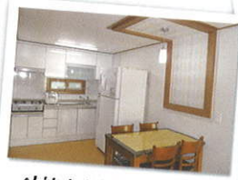
인천마리아의 집 "주방"