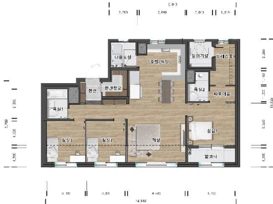
84A㎡ ( 371세대 )