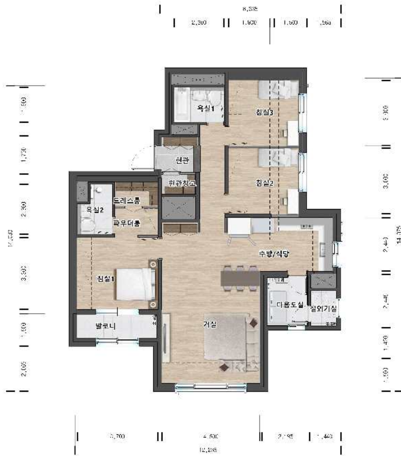
84C㎡ ( 58세대 )