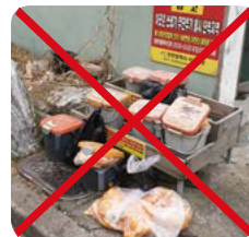
납부필증 미부착 및 무단투기