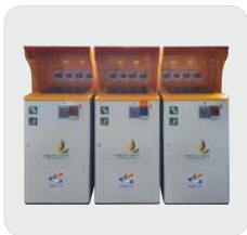
공동주택 RFID 종량제 기기