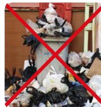
비닐 등 이물질 혼합배출