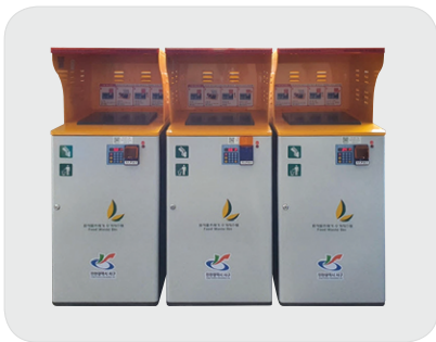
공동주택 RFID 종량제 기기