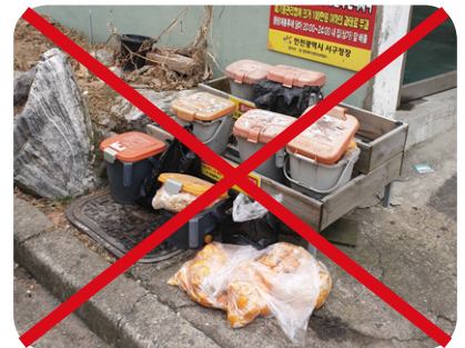
납부필증 미부착 및 무단투기

만약 종량제봉투에 혼합배출 및 불법투기할 경우 100만원 이하 과태료가 부과됩니다.