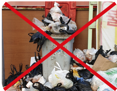
비닐 등 이물질 혼합배출