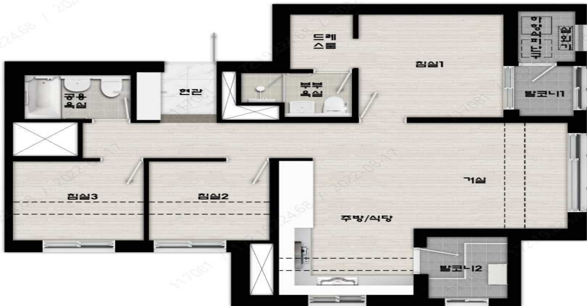
59B형 단위세대 평면도

※ 분양조건 및 분양일정문의 : LH경기지역본부 주택판매1부(031-250-8189)