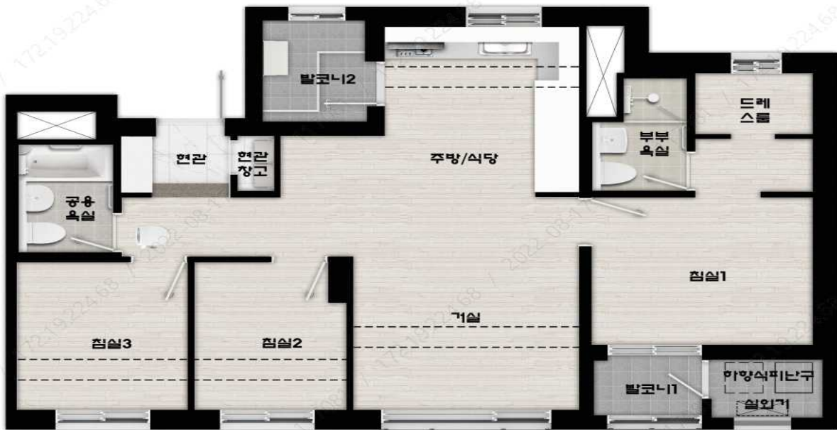
59A형 단위세대 평면도

※ 아래의 평면도는 이해를 돕기 위한 사전안내 자료이며, 설계변경 및 본 공고시 변경될 수 있습니다.