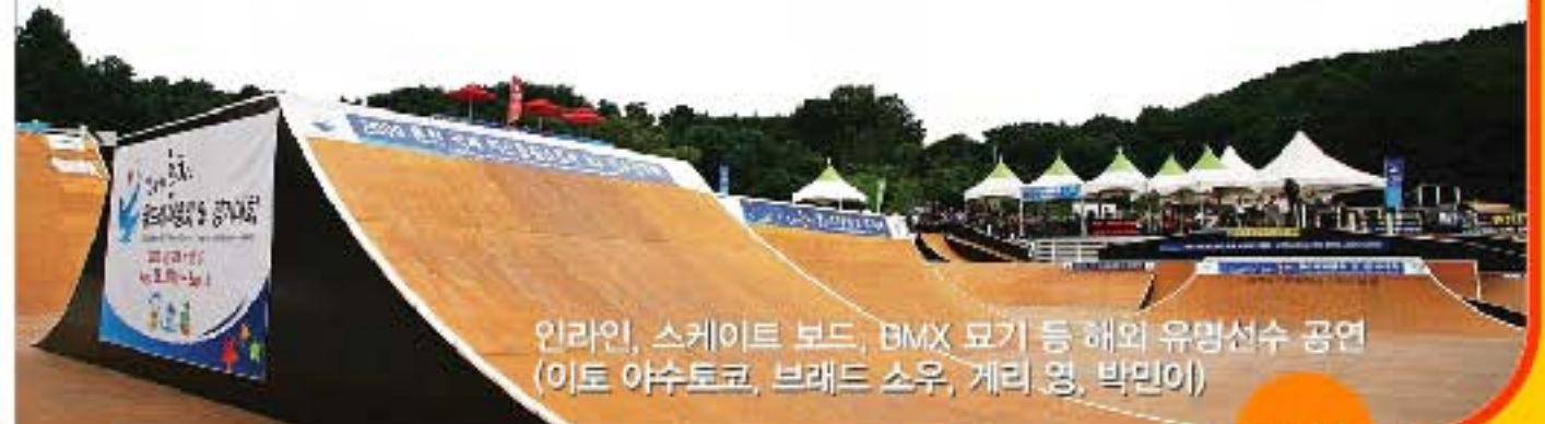
인라인, 스케이트 보드, BMX 묘기 등 해외 유명선수 공연 (이토 야수토코, 브래드 소우, 게리 영, 박민이)