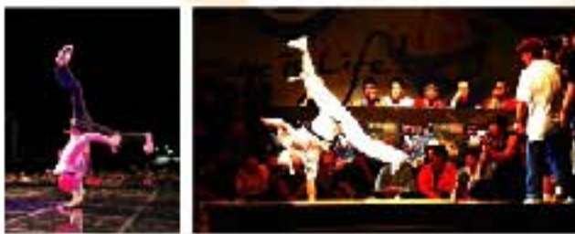
퍼포먼스 & 프리스타일 (갬블러, 익스트림 크루, 진조 크루 등)