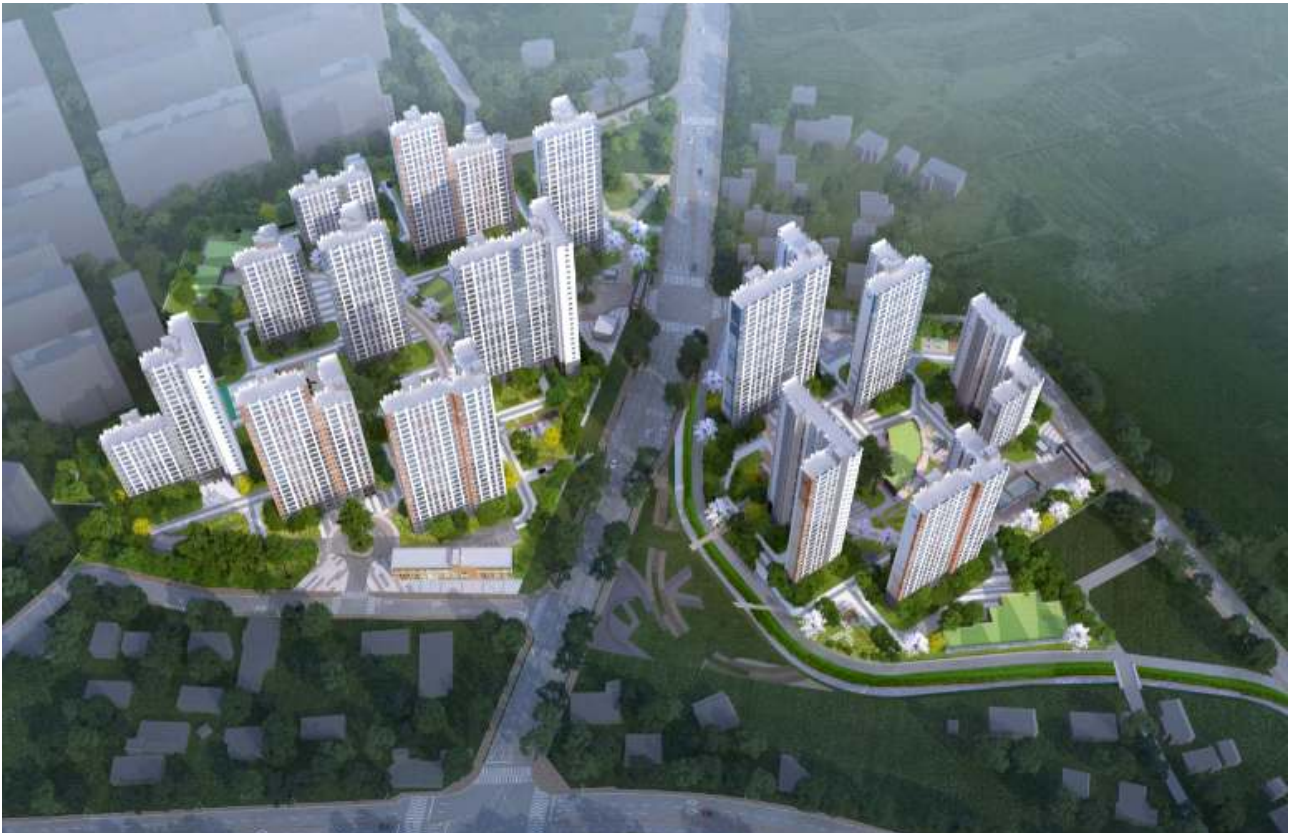
#별첨4. 단지 배치도