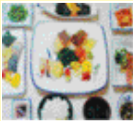
정식류 세트, 코스요리 반찬 7~8가지