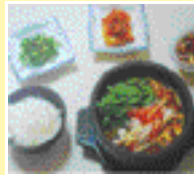
생선매운탕 대구탕, 서더리탕, 알탕 반찬 3~4가지