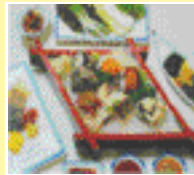
생선회류 모듬회, 광어회, 우럭회 반찬 5~6가지