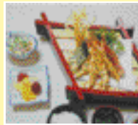
튀김정식 모듬튀김, 새우튀김 반찬 3~4가지