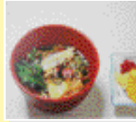
면류 소면, 우동(기락국수) 소배(메밀국수) 반찬 5~6가지