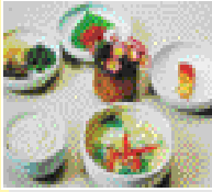
백반류 가정식 백반 반찬 5~6가지