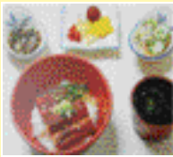
덮밥류 회덮밥, 송이덮 밥, 쇠고기덮밥 반찬 3~4가지