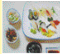
생선초밥류 모듬초밥, 주문초밥 반찬 3~4가지