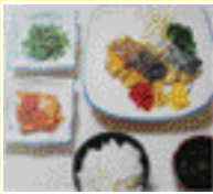
생선구이류 장어, 삼치, 청어 반찬 3~4가지