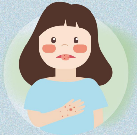
손·발·입안 수포성 발진